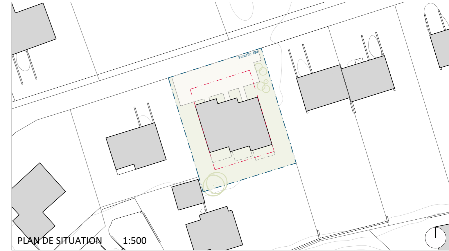
PLAN DE SITUATION 1:500